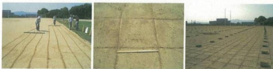
①50cm間隔にラインを引き、苗箱(25株)を配置する