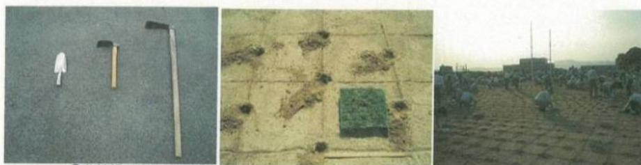
②移植鍬、小鍬(地面が硬ければ唐鍬)で深さ5cm程度の穴を掘る