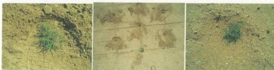
④踏みつけた後、周囲の土をポット苗の周りに戻す