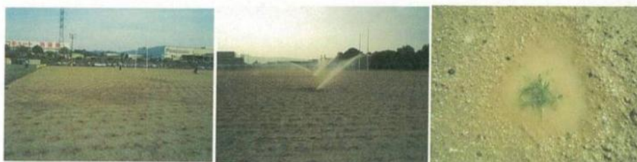
⑤移植当日はたっぷりと散水する