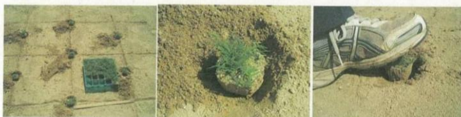
③ポット苗を1株ずつ穴に置いて、足でしっかりと踏みつける