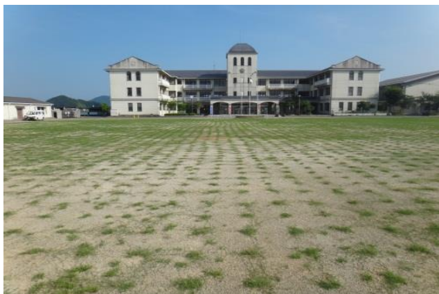
植付け 1 ヶ月後の模様 撮影日：2012 年 6 月 23 日