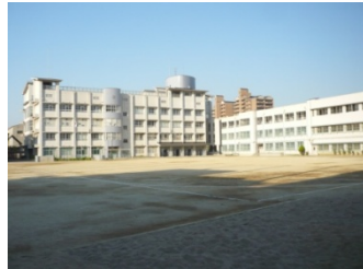
堺市立月州中学校